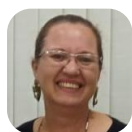
Escrito por Célia Orsi

*Atividade disponível para impressão no final do documento